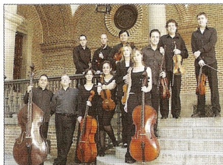
Anima Mvsica actuó en el Festival